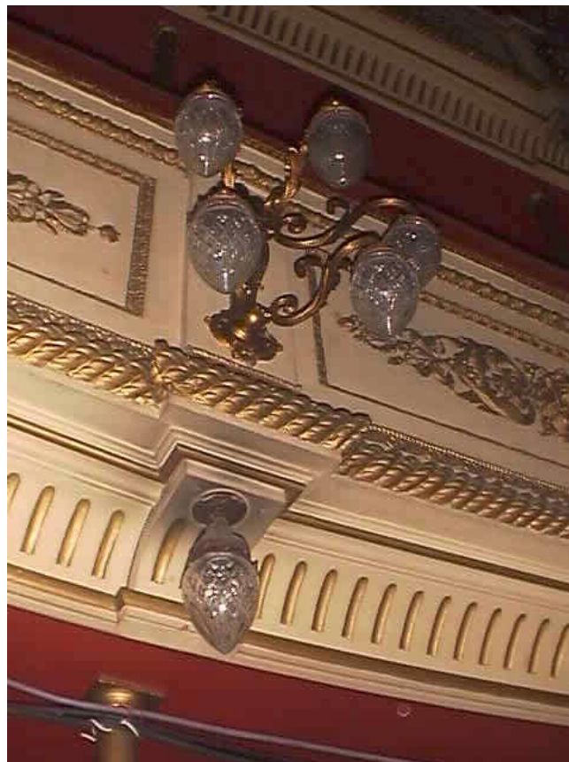
Luminarias de Sala