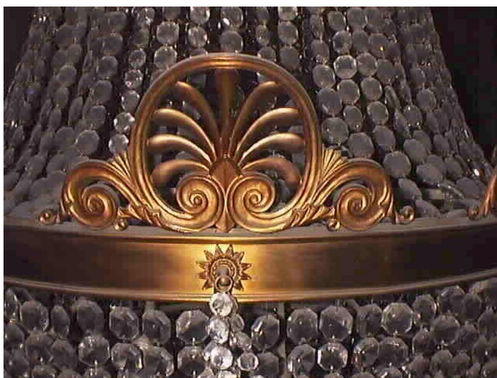
Araña de Foyer