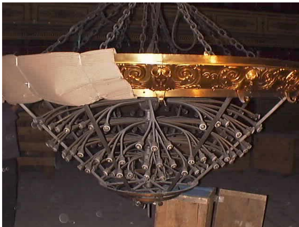
Araña principal de Sala